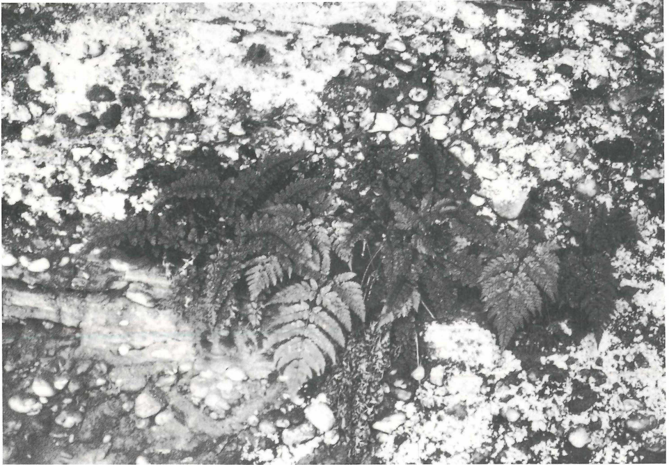
Fig. 3. Sickert (station C-9). Asplenium billotii avec Dryopteris carthusiana .

C-7 – Haselbourg : Asplenium billotii y était très rare et le plus souvent inaccessible sur des rochers au sud du village d'après E. W a l t e r. Cette station n'a jamais été revue en raison des difficultés d'accès.