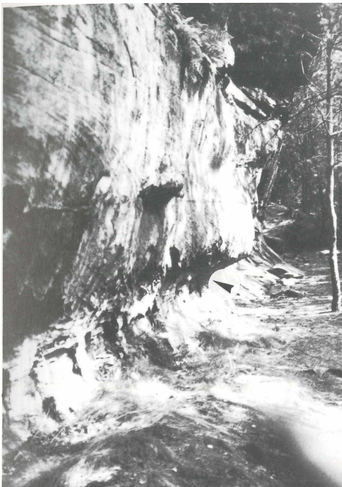
Fig. 2. Falkenfels (station A-3). La flèche indique l'emplacement des plantes.

B-5 – Rocher des Faucons: Cette station située également à 320 m se trouve en face du rocher des Dames sur le versant sud de la vallée de Champagne. E. Walter y a dénombré quelques pieds en 1907, 6 en 1915, 9 en 1917 et 3 en 1937. Les 4 pieds qui s'y maintiennent actuellement ne sont pas accessibles.