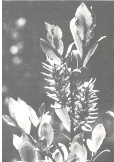
Abb. 13: Salix phylicifolia , weibliche Kätzchen

In Schwedisch-Lappland konnten wir feststellen, dass Salix phylicifolia auch dort gleichartige, kurze Holzstriemen aufweist, wie wir sie am schweizerischen Fundort beobachtet hatten!