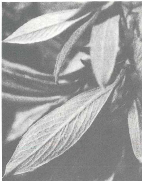
Abb. 10: Salix lapponum , Blatt lanzettlich, lang zugespitzt, silberweiss behaart, Seitennerven nach vorne gebogen