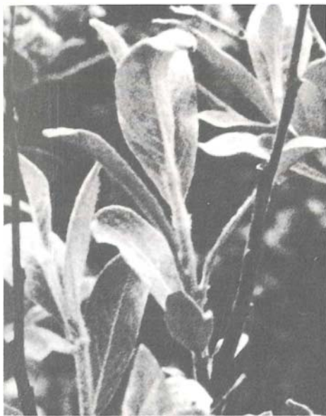
Abb. 8: Salix glauca , Blatt elliptisch, 3–4,5 cm lang, hell behaart, verkahlend

Salix glauca ist im hohen Norden weit verbreitet. Habituell ähnlich ist Salix stipulifera Floderus ex Hayrén; diese Form unterscheidet sich von Salix glauca durch 1 cm lange, spitze Nebenblätter. Blütezeit vor S. glauca . Beide Species fehlen in den Alpen! FLODERUS hat die alpine Salix glaucosericea von der nordländischen Salix glauca abgetrennt.