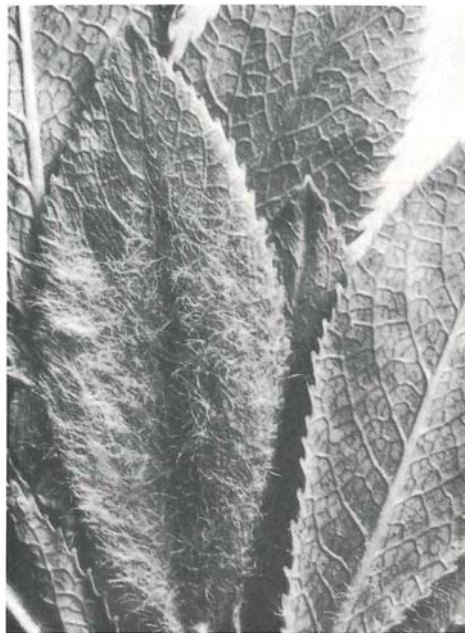
Abb. 7: Salix breviserrata , Blatt 2×vergr. Oberseite spinnwebig behaart, Unterseite kahl, glänzend