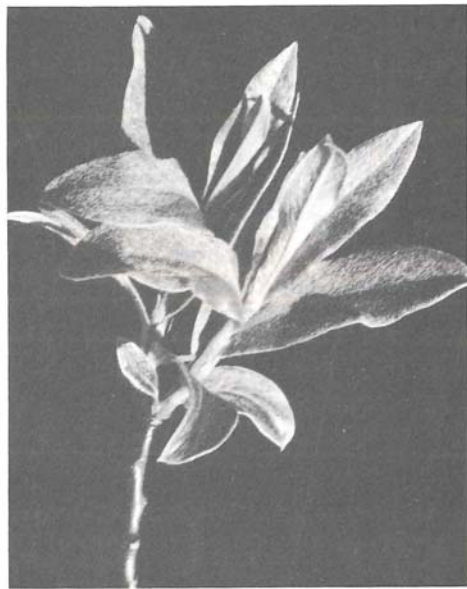
Abb. 9: Salix glaucosericea , Blatt lanzettlich, 4–6 cm lang, mit längsgerichteten Seidenhaaren, nicht verkahlend

Strauch oft über 1 m hoch, Äste und Zweige zerstreut behaart, verkahlend, hellbraun. Blatt lanzettlich, 4 bis 6 cm lang, ganzrandig, weich, etwas dick; Oberseite grün, beidseitig mit feinen, längsgerichteten Seidenhaaren bedeckt, selten verkahlend. Trockenes Blatt fahlgrün.