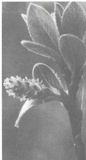
Abb. 4: Salix foetida , blüht mit Blattaustrieb