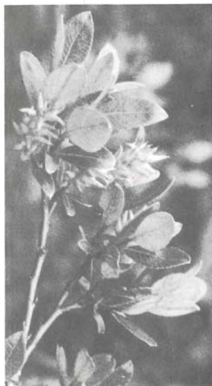
Abb. 3: Salix arbuscula , blüht nach Blattaustrieb

Heute sind die drei deutlich verschiedenen Formen als vollwertige, eigene Species anerkannt!