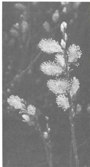
Abb. 5: Salix waldsteiniana , blüht vor Blattaustrieb