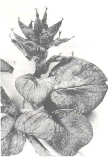
Abb. 1: Salix polaris , nordische Spalierweide, 4×vergr.