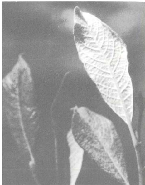
Abb. 11: Salix helvetica , Blatt etwas verkehrt-eiförmig, Oberseite zuerst behaart, dann grün glänzend, Unterseite weiss filzig