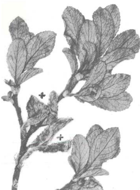
Abb. 6: Salix myrsinites , 1:1, verdorrte, letztjährige Blätter bleiben bis zum nächsten Sommer am Strauch hängen! +