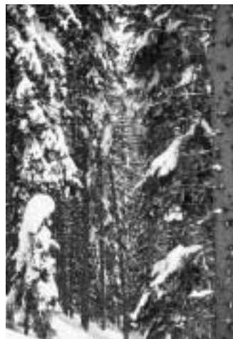
Abb. 3, rechts: Junge Fichte mit Befall durch den Schwarzen Schneeschnitz Herpotrichia juniperi . Das Pilzmyzel entwickelt sich unter der Schneedecke, überwächst die Nadeln zunächst epiphytisch, wird dann durch Bildung von Haustorien ektoparasitisch und dringt schliesslich ins Nadelinnere vor.

Abb. 2, links: Schneebeladene Fichte im Lusiwald. Bei Lufttemperaturen über -3 °C bleibt besonders viel des niederfallenden Schnees auf den Ästen und Baumwipfeln haften.