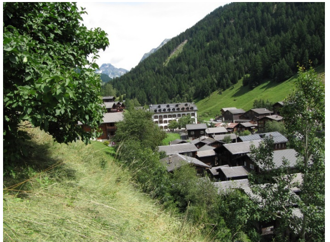
Binn, talaufwärts, 9. August 2012