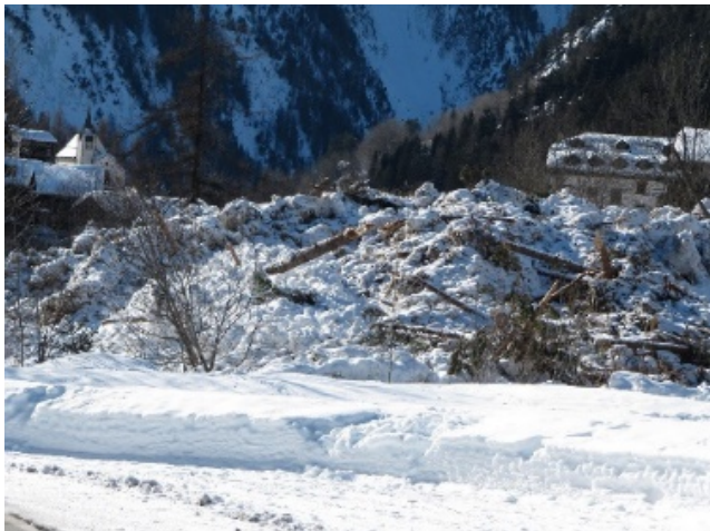
Binn, talabwärts, 14. Februar 2018